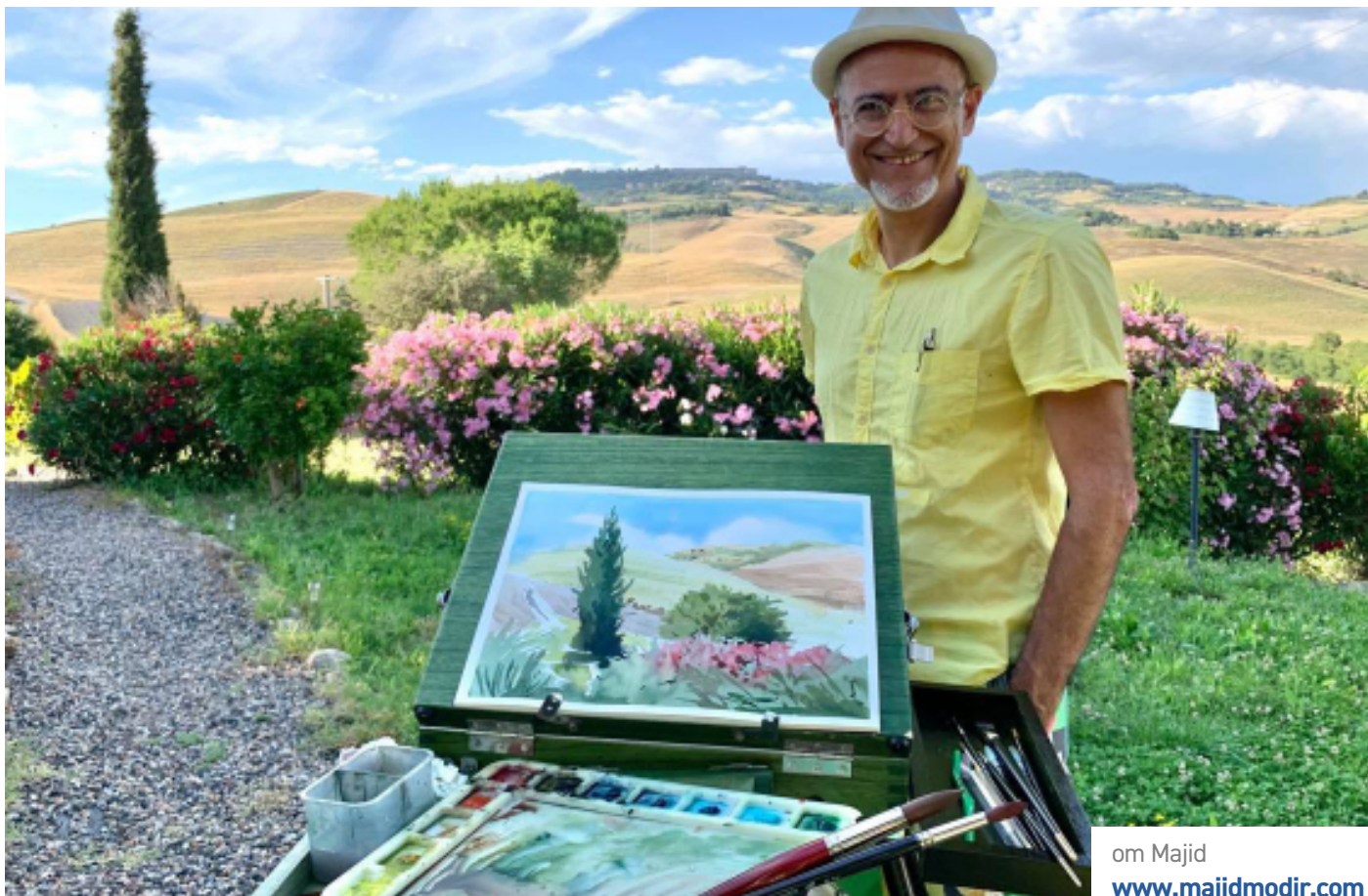
om Majid www.majidmodir.com